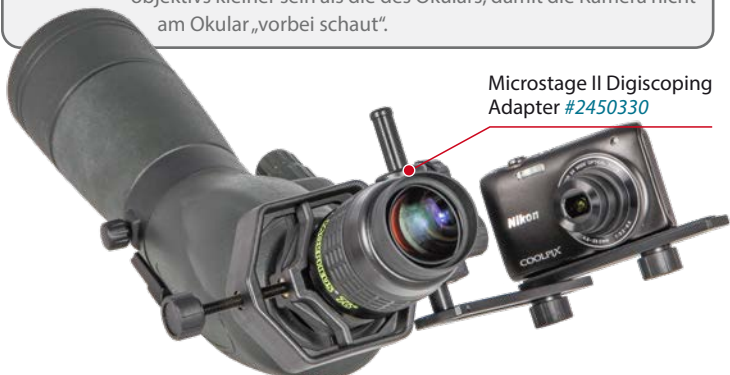
Microstage II Digiscoping Adapter #2450330

Durch die große Augenlinse der Morpheus®-Okulare können Sie auch größere Kompaktkameras verwenden; idealerweise sollte die Linse des Kameraobjektivs kleiner sein als die des Okulars, damit die Kamera nicht am Okular „vorbei schaut“.