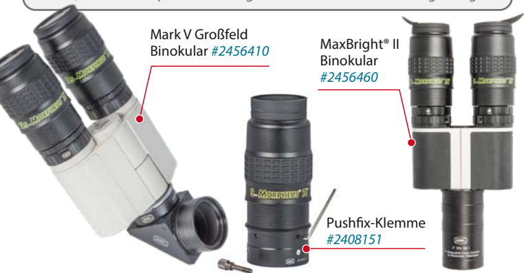
Mark V Großfeld Binokular #2456410

Das schlanke Design der Okulare ist für den Einsatz am Binokularansatz optimiert. Wo andere Weitwinkelokulare mit mächtigen Gehäusen beeindruckend wirken wollen, sind die Morpheus® nur so groß und schwer wie unbedingt nötig.