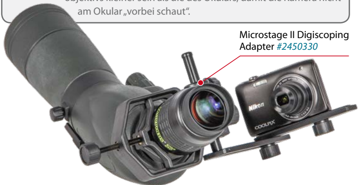
Microstage II Digiscoping Adapter #2450330

Durch die große Augenlinse der Morpheus®-Okulare können Sie auch größere Kompaktkameras verwenden; idealerweise sollte die Linse des Kameraobjektivs kleiner sein als die des Okulars, damit die Kamera nicht am Okular „vorbei schaut“.