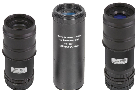
Telezentrische Systeme TZ-2, TZ-3 und TZ-4

Das TZ-3 unterscheidet sich von beiden anderen TZ-Systemen dadurch, dass das Linsensystem für ein H- \alpha Etalon mit 46 mm Maximalgröße ausgelegt wurde, um auch die großen Research-Grade-Filter von SolarSpectrum vollkommen auszuleuchten. Aus diesem Grund ist das Gehäuse auch beidseitig mit 2" (50.8 mm) Gewinden ausgestattet, und es sind alle Adapter im Lieferumfang enthalten um das TZ-3 beidseitig an 2" oder an T-2 (M42x0.75 mm) Gewinden anschließen zu können. Alle Solar Spectrum Filter werden ebenfalls beidseitig mit 2" und mit T-2 Gewinden ausgeliefert.